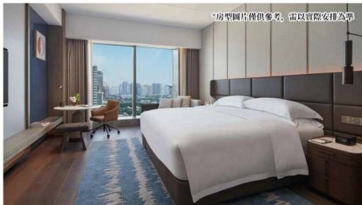
*房型圖片僅供參考，需以實際安排為準