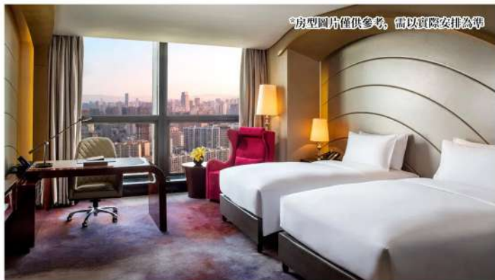
*房型圖片僅供參考，需以實際安排為準